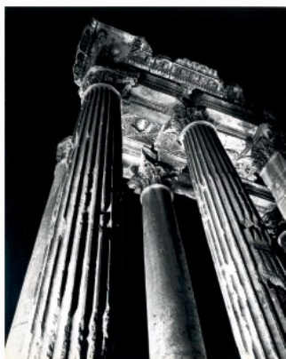
ACROSS BOUNDARIES, MANOUG ALEMIAN, TEMPLE DE BACCHUS LA NUIT, 1963.

Beirut Art Fair 2018 propose un programme V.I.P. comprenant visites d'ateliers, de collections privées et de musées à travers tout le Liban. Une