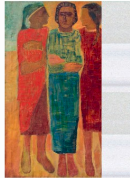
REVEALING BY SGBL, KOUR, COURTESY GNYP GALLERY. LES AMIES, PAUL GUIRAGOSSIAN ESTATE COLLECTION.

À l'occasion de son 75 ème anniversaire au Liban, Arab Bank présente une partie de sa